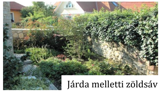
Járda melletti zöldsáv

A szakmai előkészítésnél a praktikus és egyben impozáns látványt nyújtó növénytelepítési megoldásoknak is szemponttá kellett válniuk, hogy az eltakarja a telket határoló tömör kerítést, a kültéri egységeket, az aknákat, illetve a szomszéd kertét. Fontos volt a könnyű fenntarthatóság kialakítása, ezért a növényágásokat szegéllyel határoltuk és mulcsterítést alkalmaztunk.